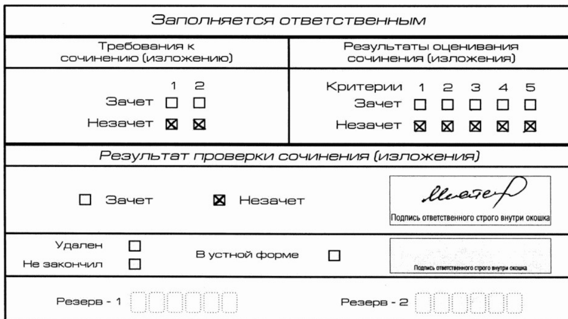
Рис. 8. Область для оценки работы