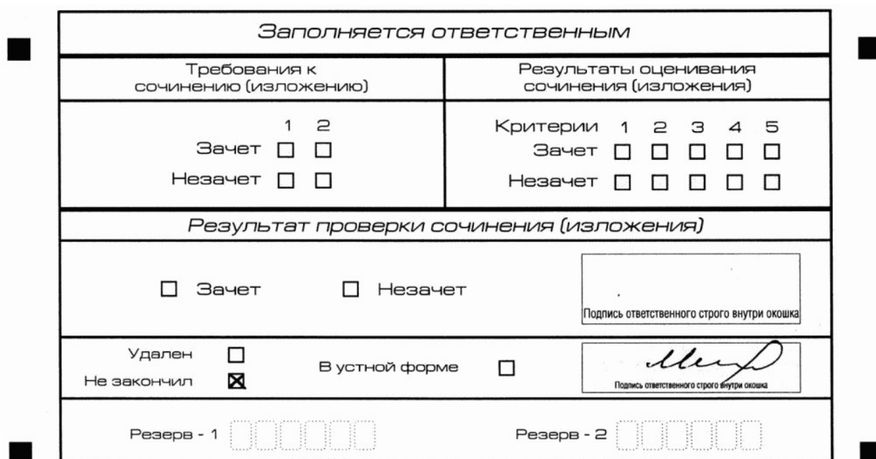
Рис. 12. Заполнение полей нижней части бланка регистрации (участник не закончил написание сочинения (изложения) по уважительным причинам)

написания итогового сочинения (изложения) по уважительным причинам" (форма ИС-08), вносят соответствующую отметку в форму ИС-05 "Ведомость проведения итогового сочинения (изложения) в учебном кабинете ОО (месте проведения)" (участник итогового сочинения (изложения) должен поставить свою подпись в указанной форме). В бланке регистрации указанного участника итогового сочинения (изложения) необходимо внести отметку "X" в поле "Не закончил" для учета при организации проверки, а также для последующего допуска указанных участников к повторной сдаче итогового сочинения (изложения) в дополнительные сроки. Внесение отметки в поле "Не закончил" подтверждается подписью члена комиссии по проведению итогового сочинения (изложения) (см. рис. 12).