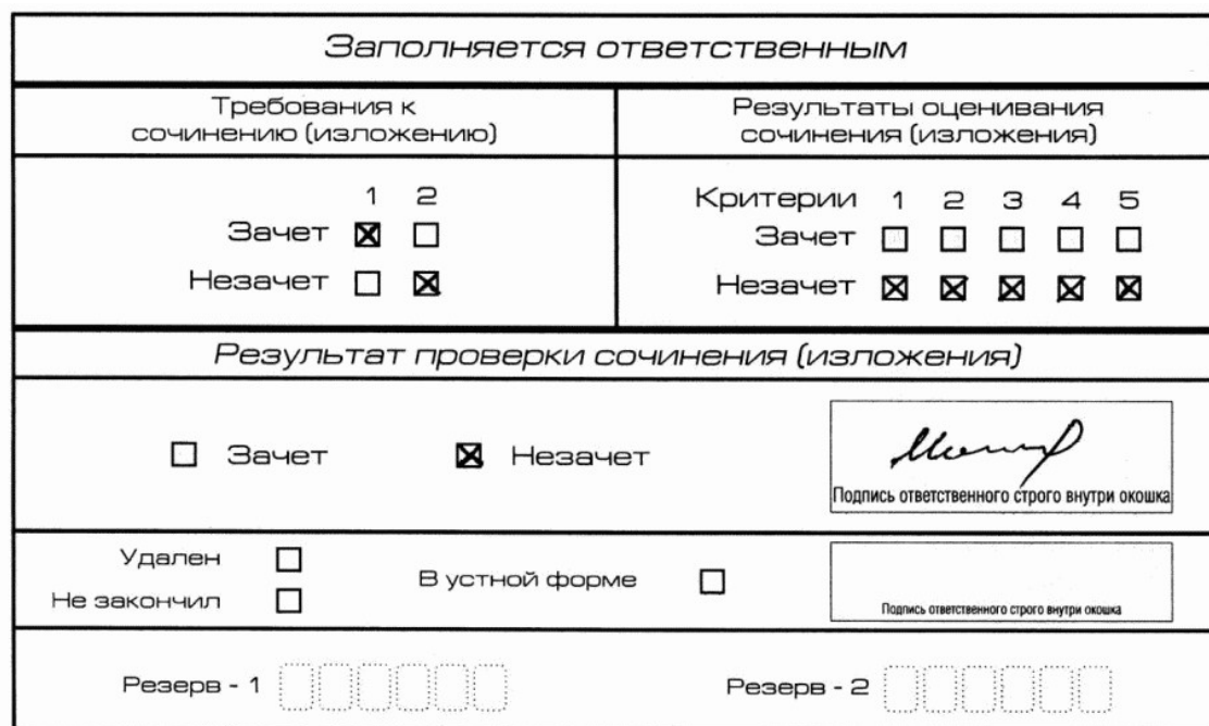
Рис. 9. Область для оценки работы

Если итоговое сочинение (изложение) соответствует требованию N 1 и требованию N 2 , то выставляется "зачет" за выполнение требования N 1 и требования N 2 . Указанные сочинения (изложения) далее оцениваются по критериям.