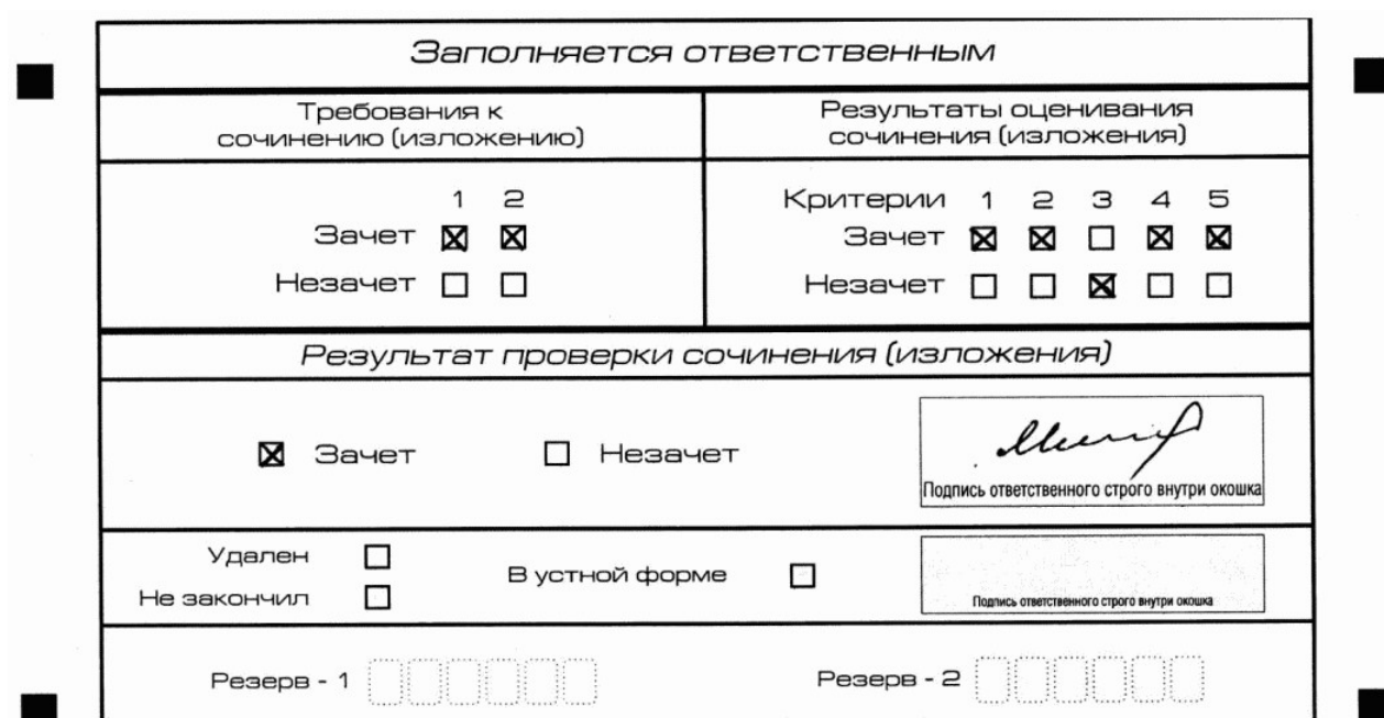
Рис. 10. Область для оценки работы

3. Во всех остальных случаях итоговое сочинение (изложение) проверяется по всем пяти критериям и оценивается по системе "зачет"/"незачет".